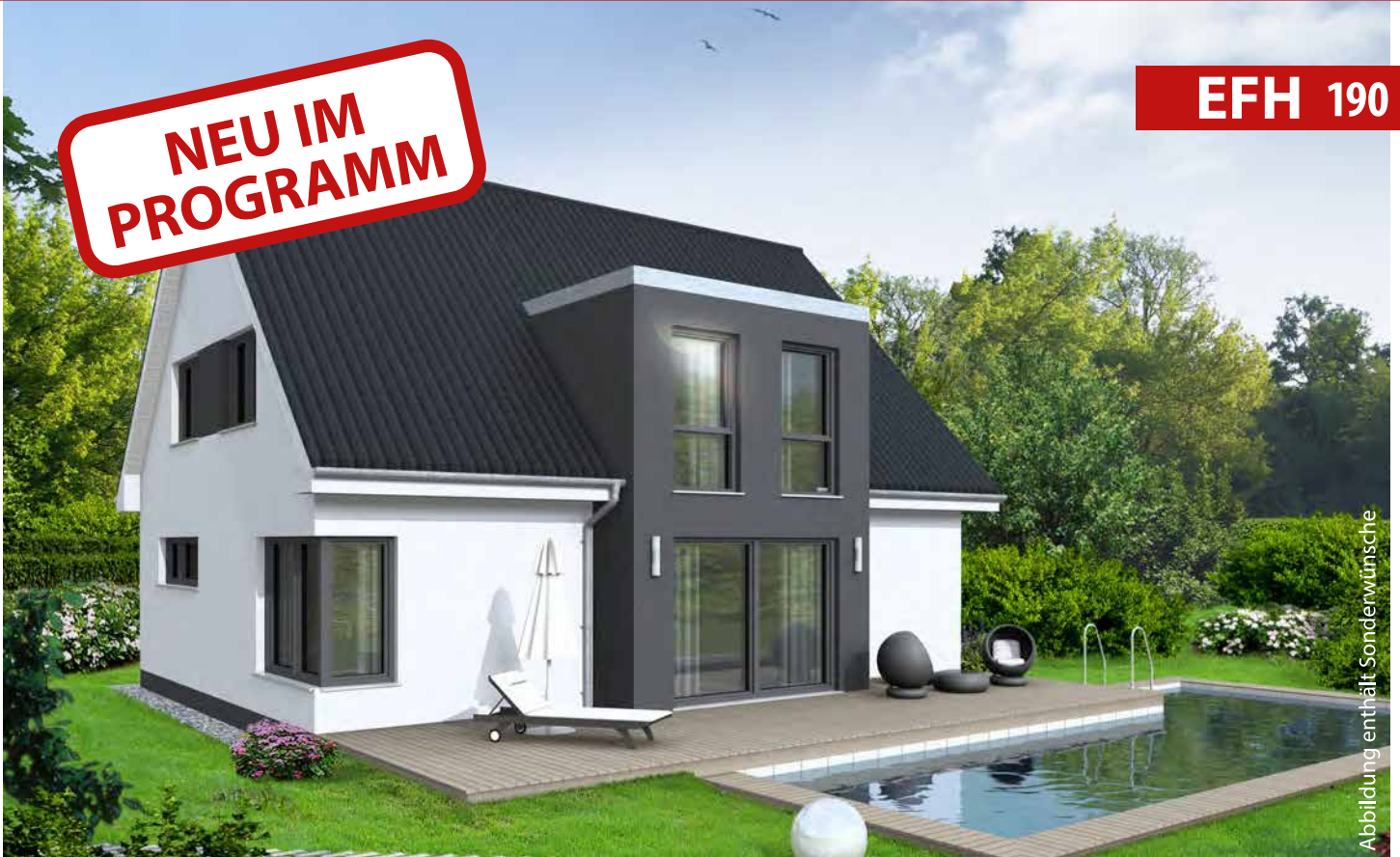
Abbildung enthält Sonderwünsche