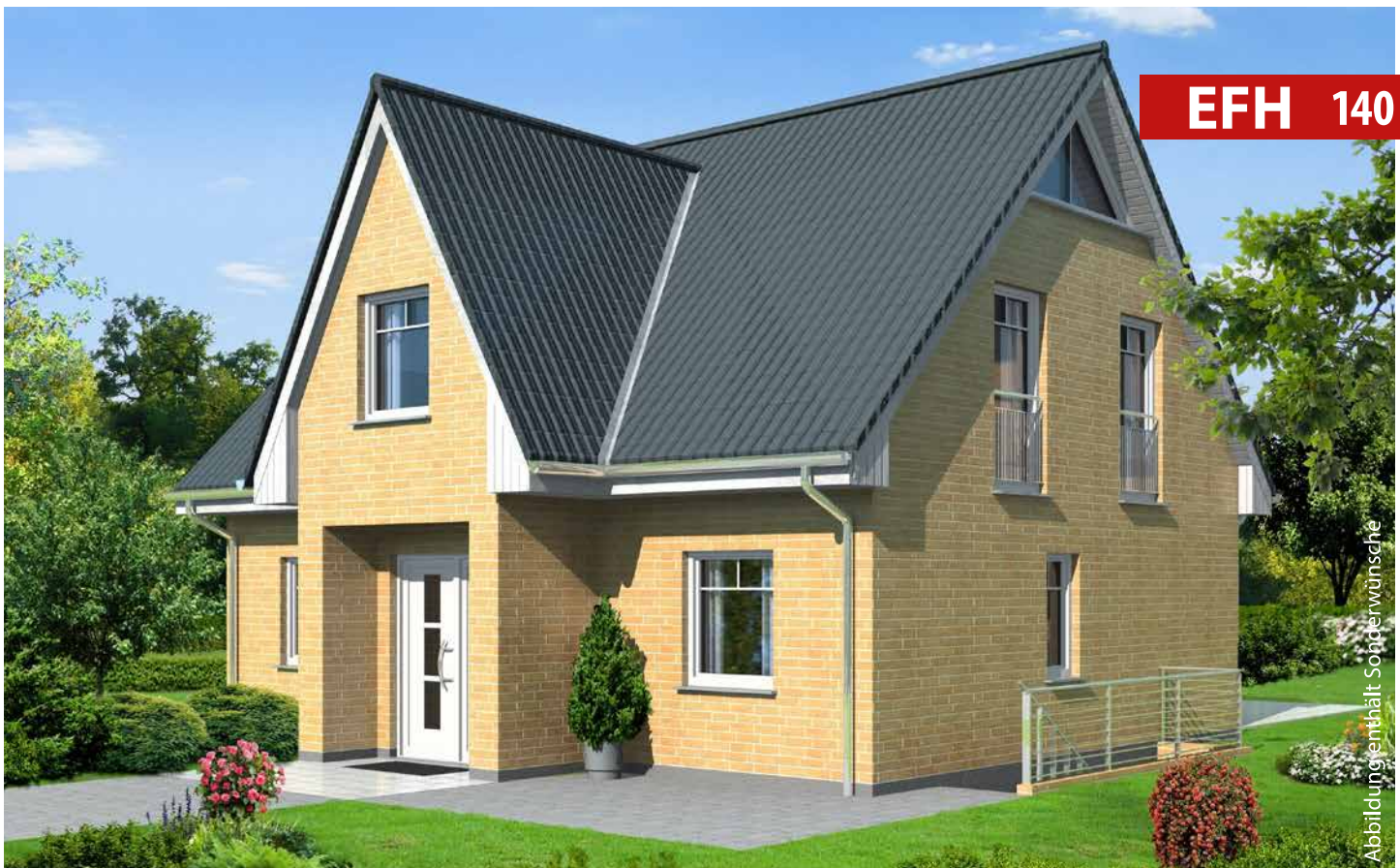
Abbildung enthält Sonderwünsche