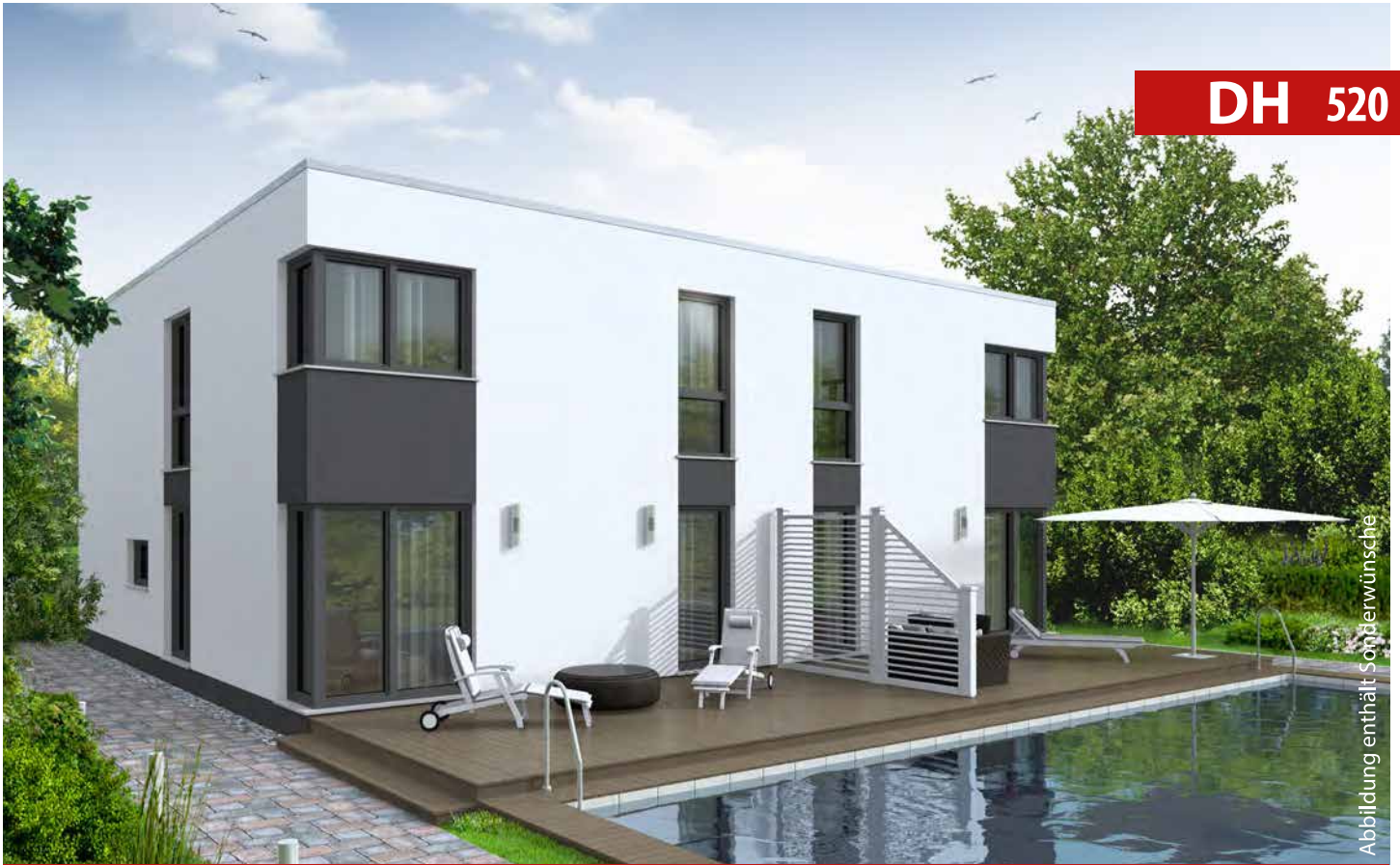
Abbildung enthält Sonderwünsche