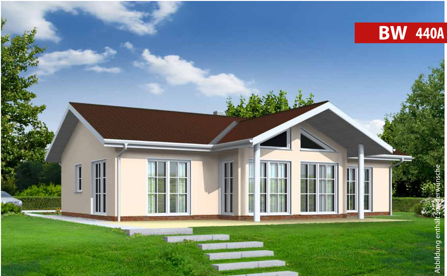
Abbildung enthält Sonderwünsche