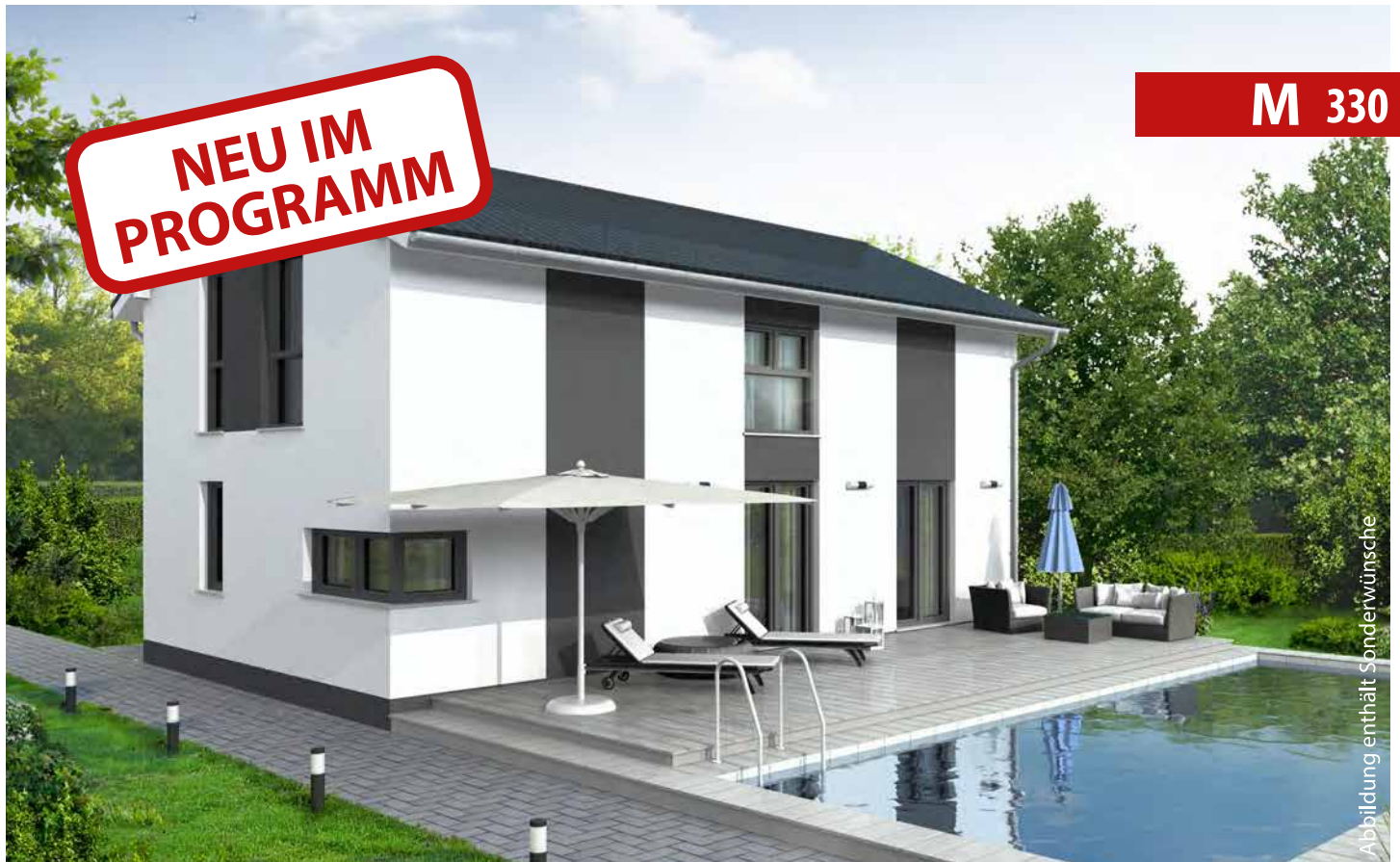
Abbildung enthält Sonderwünsche