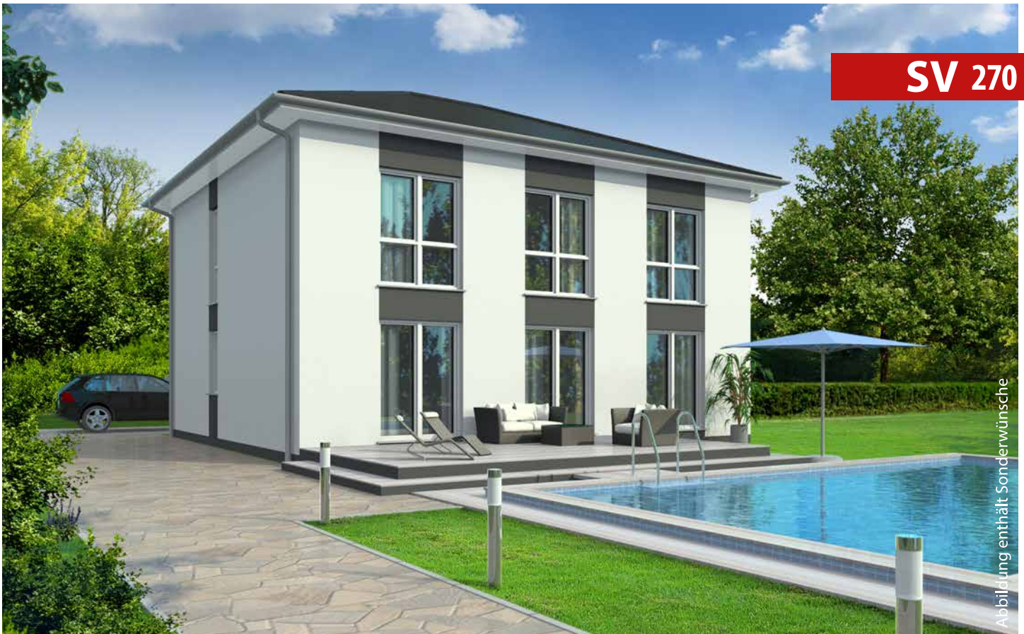
Abbildung enthält Sonderwünsche