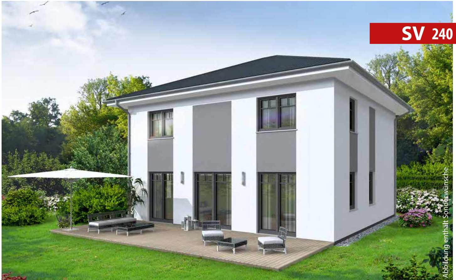
Abbildung enthält Sonderwünsche